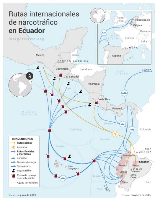
Figura 2: Rutas internacionales de narcotráfico en Ecuador.

narcotráfico , cuyas rutas han ido expandiéndose hacia Europa , siendo España, Bélgica y los Países Bajos sus principales destinatarios (véase figura 2).