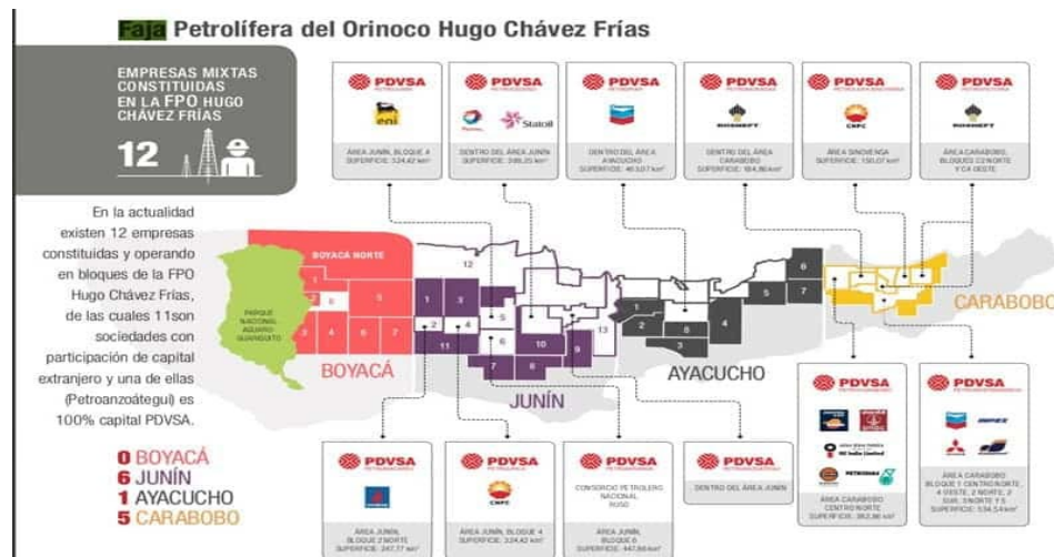
Figura 3: Empresas petroleras en la faja petrolífera del Orinoco, REPSOL está en el área Carabobo Centro Norte.

Quiriquire gas, 40% de la participación de Petroquiribire, 15% de la empresa de gas natural Ypergas y los pozos petroleros de Petrocarabobo en la faja petrolífera del Orinoco (véase figura 3).