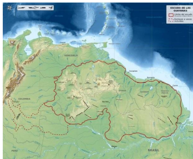
Figura 4: el Escudo Guyanes.

Esta región no solo es rica en Petróleo, el Esequibo forma parte del Escudo Guyanés (véase figura 4), un área de 270 millones de hectáreas, además de ser un área poco explorada y rica en recursos minerales como oro, diamante, coltán, bauxita, entre otros. De hecho, algunas empresas iniciaron operaciones para extraer dichos recursos como Avalon (canadiense), CMOC (china) y Barrick Gold (canadiense) para explotar los minerales de esa extensión geográfica. Hasta la fecha se desconoce el nivel de participación de las mineras españolas.